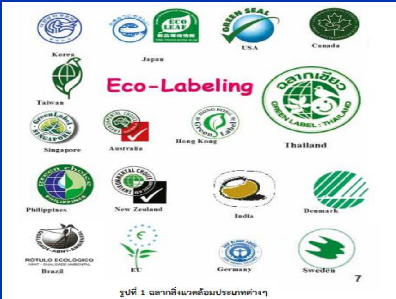
รูปที่ 1 ฉลากสิ่งแวดล้อมประเภทต่างๆ