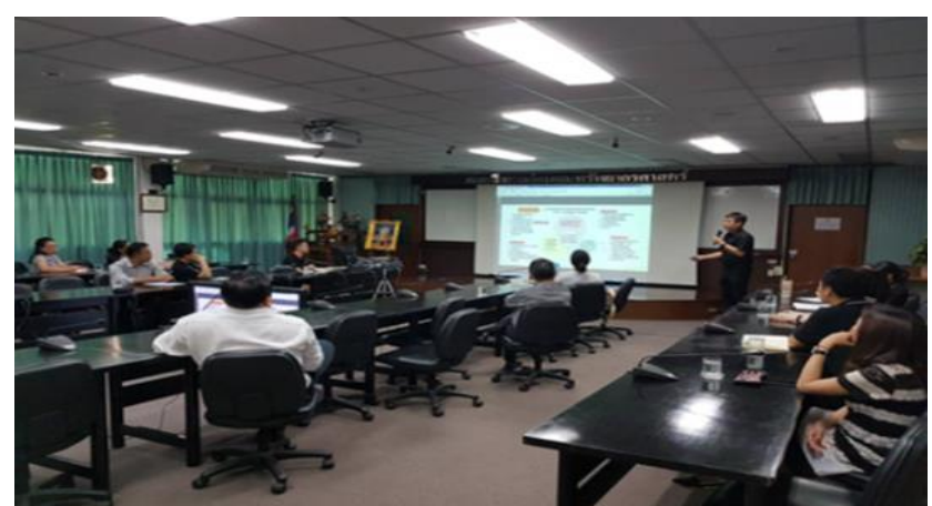
ภาพที่ 1: การพัฒนาฐานข้อมูลงานวิจัยและบริการวิชาการ ภาพที่ 2: กิจกรรมระดมความคิดเห็นและประกาศหัวข้อวิจัย