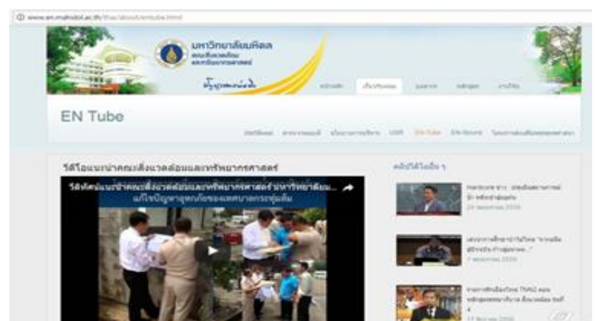
ภาพที่ 3: จำนวนผลงานวิจัยไปใช้ประโยชน์ปี 2558-2561 ภาพที่ 4: ช่องทางเผยแพร่องค์ความรู้จากงานวิจัยผ่าน Social media